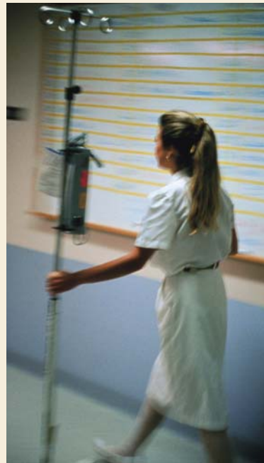
La Junta de Andalucía ha eliminado en el último año 7.027 empleos sanitarios

Estas 569 plazas de acceso libre, cuya convocatoria se ha comprometido a aprobar el SAS durante este 2013, habría que repartirlas en-