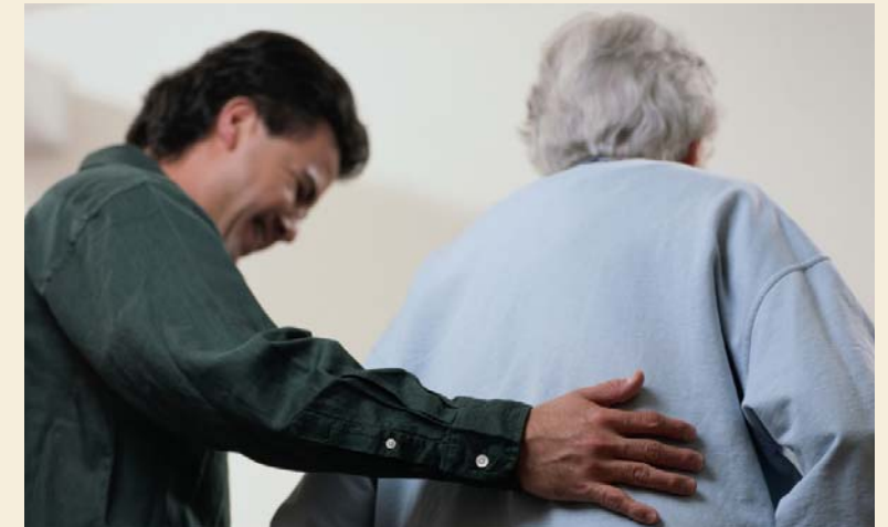
El programa formativo aborda, entre otros, temas como la higiene del paciente, su aseo e incontinencia

El Hospital Vázquez Díaz se planteó la conveniencia de programar unos talleres que supongan una herramienta que facilite la atención integral al paciente incluyendo las necesarias dosis de información y educación sanitaria, el apoyo psicológico y social, además de apostar por una atención personalizada en el seguimiento del enfermo más allá