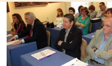
El Colegio de Jaén denuncia que este verano hay solo 2 matronas de AP para Jaén y alrededores