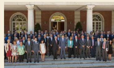
La Mesa Estatal de la Enfermería firma un gran acuerdo con Sanidad en el Palacio de la Moncloa