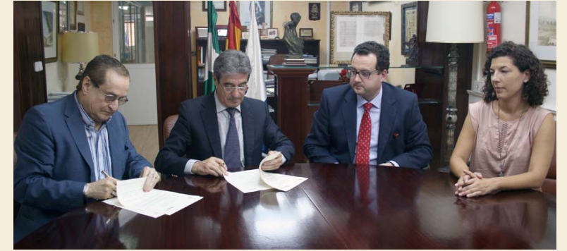
Momento de la firma entre el delegado provincial de Asisa y el presidente del Colegio de Enfermería, ante el director médico y la directora de enfermería de la Clínica Jerez

Dada la convergencia de objetivos entre ambas entidades y de los intereses comunes para promover que los profesionales obtengan el mayor nivel de competencias y conocimientos, ha sido posible la rúbrica de este acuerdo que se produjo a finales de julio en la sede del Colegio gaditano.