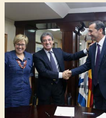
La directora del Centro Residencial Monte Alto, el presidente de los enfermeros gaditanos y el director territorial de la zona sur de SARquavitae

Los colegiados, empleados y sus cónyuges y ascendientes obtienen un descuento del 10% sobre las tarifas vigentes en los diversos centros del grupo SARquavitae