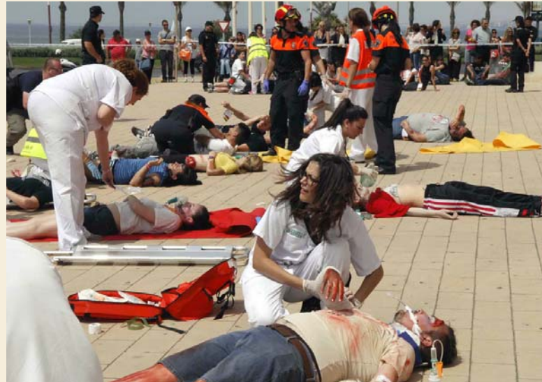
Imagen de un anterior simulacro realizado en el Auditorio Municipal Maestro Padilla

Este curso de Experto Universitario, que cuenta con el respaldo de la Escuela Internacional de Ciencias de la Salud, tiene una duración total de 500 horas lectivas, correspondientes a 20 créditos ECTS, y se podrá seguir en las modalidades presencial y virtual. En función del número final de inscripciones, los aspirantes a “expertos” se agruparán en diferentes turnos, y en cuanto a los seminarios presenciales, comprenden un total de cinco módulos referidos a estas áreas: RCP Adultos; RCP Pediátrica; Enfermería y Emergencias del paciente poli-