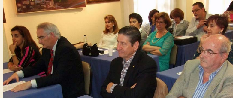
Profesionales de la enfermería de Jaén en el Día de la Matrona, el pasado mes de mayo

Durante todo el mes de agosto y las tres últimas semanas de julio (la primera trabajaron tres enfermeras especialistas), dos matronas han atendido a las usuarias de los centros de salud de Jaén capital y de las localidades de Los Villares, Valdepeñas de Jaén y Mancha Real. Ante esta situación, desde la institución colegial solicitan al Servicio Andalu-