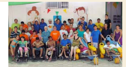
El Campamento de Verano San Juan de Dios para jóvenes discapacitados cumple 22 ediciones