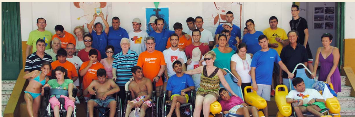
El Campamento de Verano San Juan de Dios ha cumplido 22 ediciones

La Orden de Malta y la de San Juan de Dios hacen posible esta muestra de solidaridad con los desfavorecidos